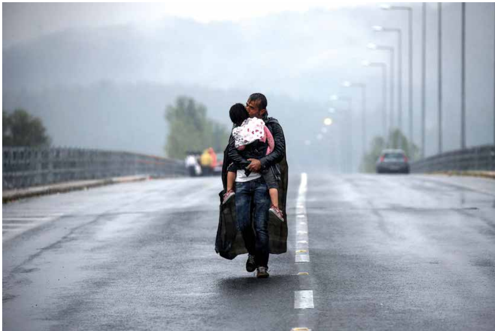
Refugiado sírio abraça filha sob a chuva em Idomeni, Grécia.

“Culpo-me por não ter feito mais. Também tenho sangue de refugiado.” Yannis Behrakis