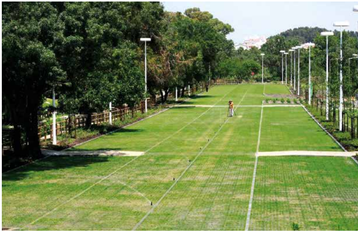
Novo parque de estacionamento da Quinta da Carreira, em S. João do Estoril, tem 200 lugares gratuitos e zona verde.

O parque terá também um sistema de vídeo vigilância, incorporado nos equipamentos de iluminação. Será igualmente instalado um sistema wi-fi para uso dos utentes do parque e, assim, generalizar o acesso às novas tecnologias. “Apesar de não ter sido um projeto pacífico, este parque está concluído