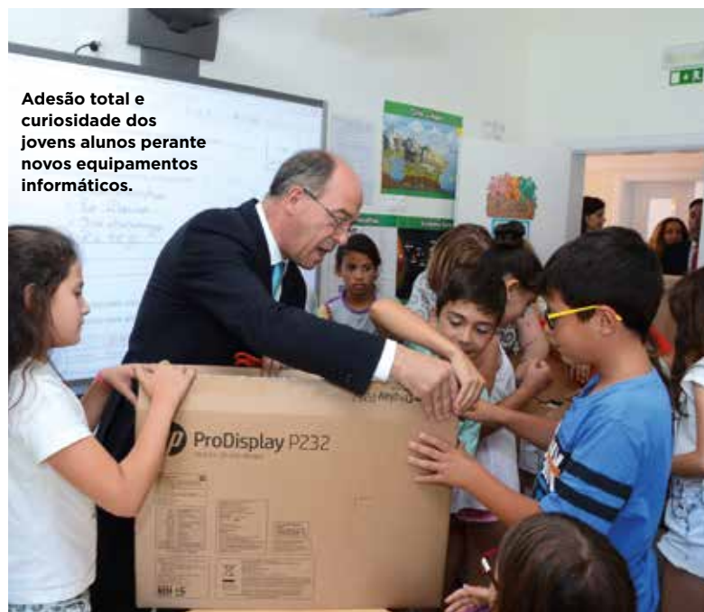
Adesão total e curiosidade dos jovens alunos perante novos equipamentos informáticos.

“Trata-se também do reconhecimento da excelência da escola pública que existe em Cascais,