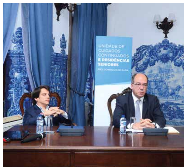
Apresentação do projeto da nova Unidade de Cuidados Continuados

cia-se pela aposta na inovação tecnológica, única no país, e pela originalidade de ser servido de gatis e canis, permitindo que os donos não sejam separados dos seus animais de estimação. Os equipamentos serão construídos na freguesia de S. Domingos de Rana, aproveitando um terreno com mais de 5.300 m 2 , cujo direito de superfície será cedido à entidade Quimera Saúde, por um período de 50 anos, renovável por períodos de dez. |C|