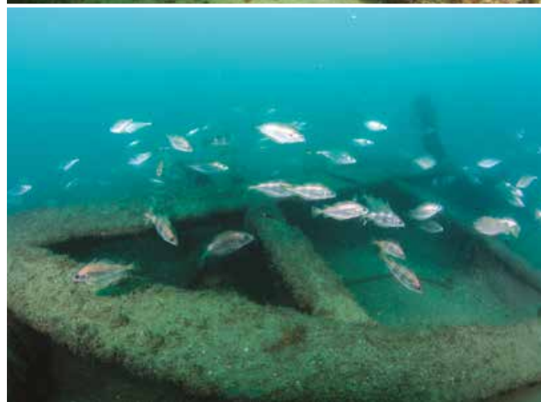
Cascais já tem tradição no estudo e proteção do seu património subaquático.