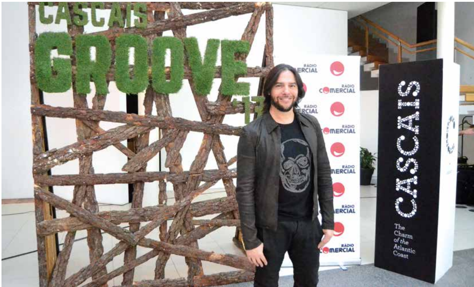
O bailarino Joaquín Cortés estreia em Cascais um novo espetáculo

No dia 23 de junho, Manuela Azevedo e Bruno Nogueira, entre outros músicos, estarão no palco com o concerto “Deixem o Pimba em Paz”