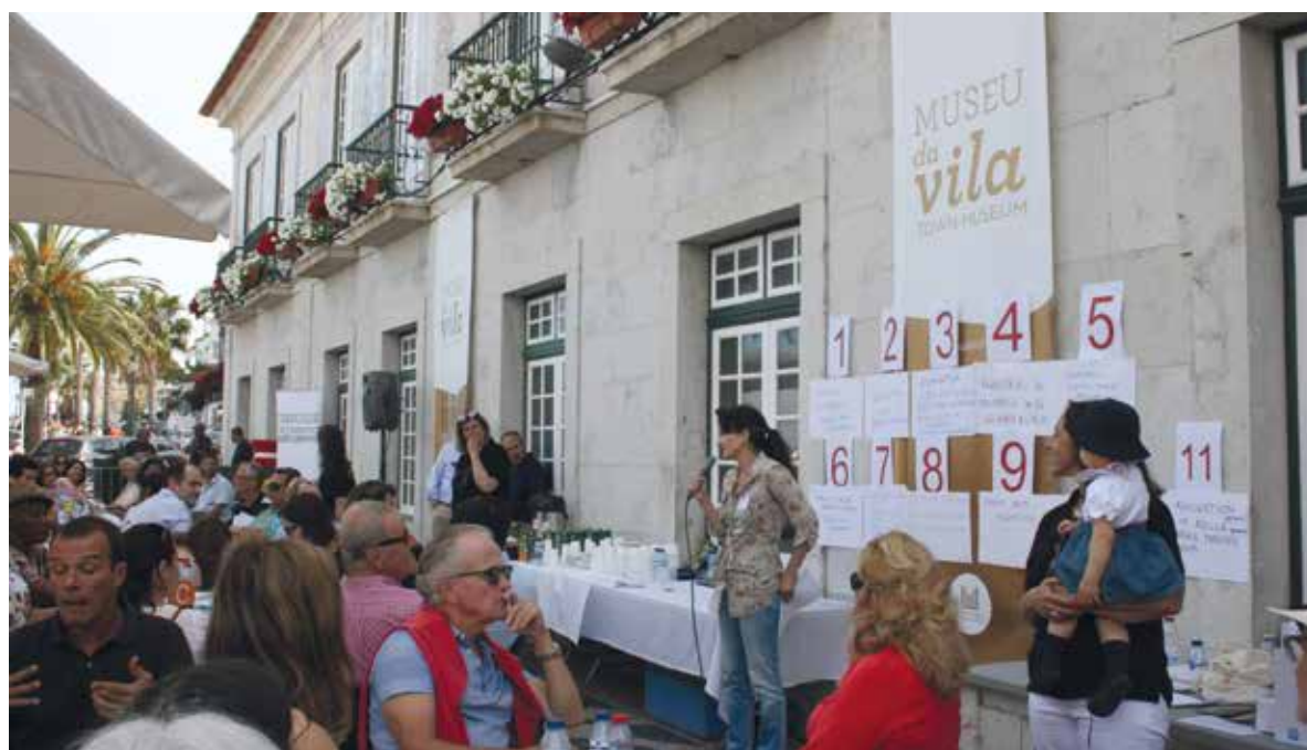
A forte adesão dos cidadãos é um dos segredos do sucesso do OP Cascais