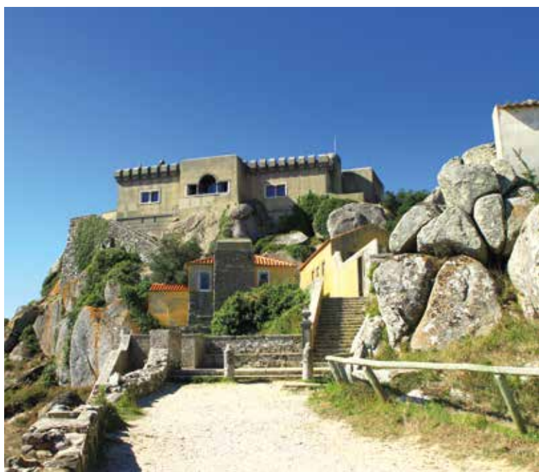
Boas práticas na gestão da Quinta do Pisão podem ser replicadas na Quinta da Peninha.

A Câmara de Cascais vai, assim, gerir a “Tapadas-Peninha”, uma área natural com quase 600 mil metros quadrados, cujo valor patrimonial é reconhecido a nível mundial. Trata-se de uma aposta integrada na estratégia desta autarquia de valorizar o Parque Natural de Sintra-Cascais, a exemplo do trabalho que Cascais tem vindo a desenvolver na Quinta do Pisão, reforçando a conservação da natureza, com a abertura do espaço ao público. |C|