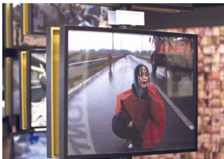
Foto integrante da exposição de Behrakis retratando criança refugiada perdida dos pais.

Nasceu em 1960 em Atenas. Estudou fotografia e começou a trabalhar para a Reuters em 1988. O seu primeiro trabalho no estrangeiro foi a cobertura da crise Líbia, em Janeiro de 1989. Desde então, cobriu eventos que vão das exéquias do Ayatollah Khomeini no Irão, aos conflitos nos Balcãs, Croácia, Bósnia, Kosovo, as guerras na Chechénia, Serra Leoa, Somália, Afeganistão, Líbano, a Primavera Árabe no Egipto, Líbia e Tunísia, bem como o conflito israelo-palestino. Acumulou prémios que vão do fotógrafo do ano do “Guardian” (2015) ao “Pulitzer”, partilhado com a sua equipa (2016), por ter registado imagens espantosas sobre a